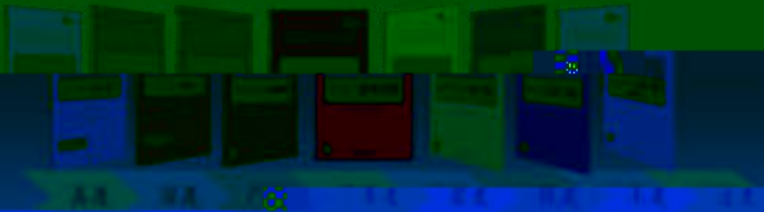
一体化课程教学设计 综合实训基地